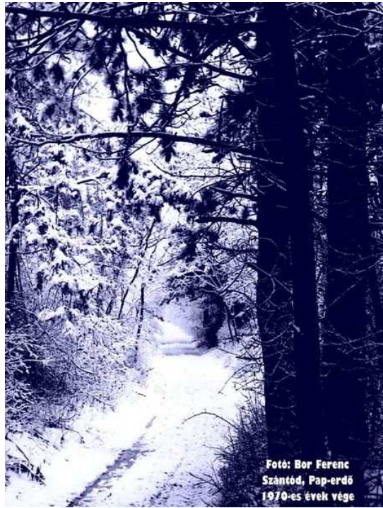
Szántód, Pap-erdő 1970-es évek vége