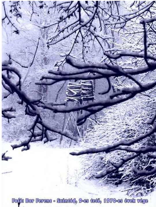
Szántód, 9-es tető, 1970-es évek vége