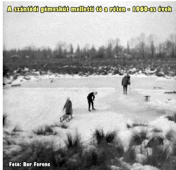
A szántódi gémeskút melletti tó a réten - 1960-as évek