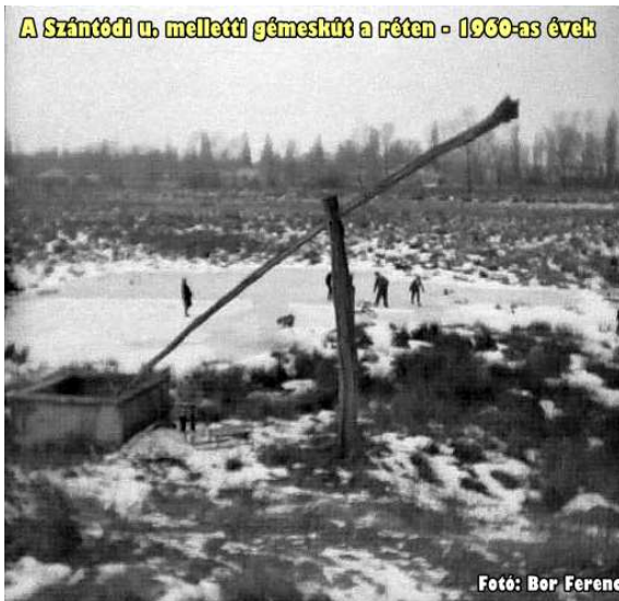
A Szántódi u. melletti gémeskút a réten - 1960-as évek