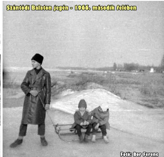
Szántódi Balaton jegén - 1966. második felében