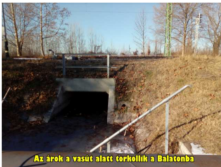
Az árok a vasút alatt torkollik a Balatonba