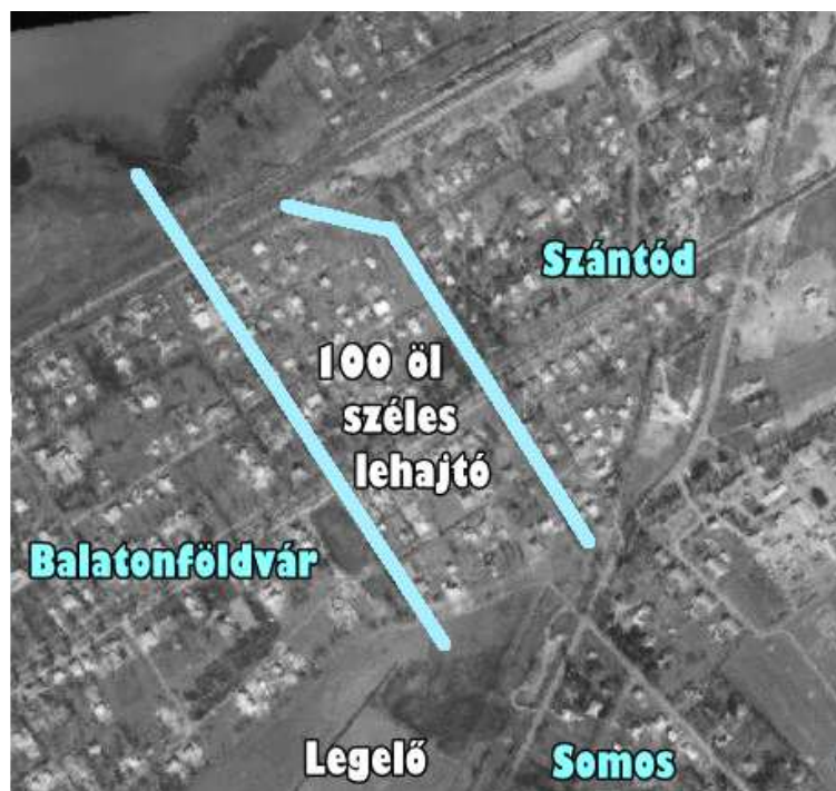
A képen kék színnel vannak jelölve a 100 öles sávot határoló árkok. A bal oldali árok a határárok, míg a jobb oldali a platán allé árka.

Kicsit forgassuk vissza az idő kerekét! A régi időkben Kőröshegy – Szántód és Balatonszárszó közé ékelődve – nagy Balaton parttal rendelkezett. Kőröshegy területén volt Földvárpusztá, amely 1948-ban önállósulva kivált Kőröshegyből. Ekkor Kőröshegy parti része már csak a 100 öl széles területre korlátozódott. Majd később (talán a 70-es években) ezt a területet is Földvárhoz kapcsolták. Ezzel teljesen megszűnt Kőröshegy vízparti kapcsolata. (Ami biztos, hogy Kőröshegy 1977 tavaszán társult Balatonföldvással, így Földvással alkotott egy Közös Községi Tanácsot. A becsatlakozó falvak jogilag megmaradtak, de csak előljáróik voltak. A Közös Tanács egy tanácselnökkel egy testülettel és egy költségvetéssel működött.)