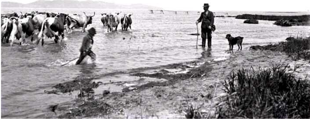
A kőröshegyi marhák itatása a Balatonban, Szántód nyugati végénél kb.1862-1863. körül. Háttérben a bejáróhid, amelyen a vonattal érkezők eljuthattak a hajóhoz.

Ezt a lehajtót két árok szegélyezte: az egyik a platánallé melletti árok (lásd az 1. részben), a mai Balatonföldvár és Szántód határán; a másik pedig ettől 100 öl (182,88 m) távolságra Földvár felé található. Ma is megvan mindkét árok. A Földvár felőli határárok két célt szolgált: jelölte a lehajtásra szolgáló kőröshegyi terület határát, valamint kezdetben a rétről vezette le a vizet a Balaton felé. Később – talán az 1950-es években – csatorna ásásával a földvári halastó felé csapolták le a vizet a rétről.